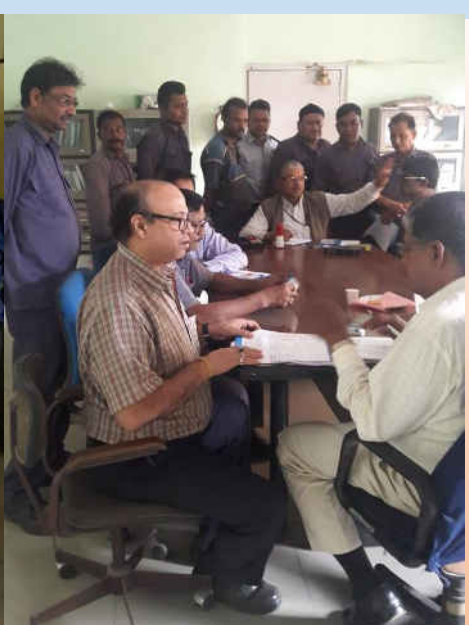
A free health check-up camp for employees was organised at Industrial Packaging, Kolkata on 6 th December 2018.