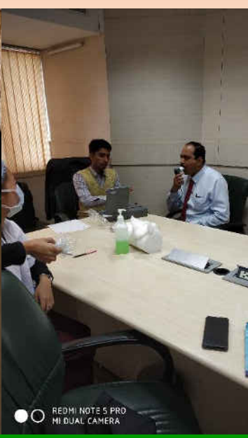
A free health check-up camp in association with Medeor Hospital, a Unit of VPS Healthcare was organised for employees in Delhi on 18 th December, 2018. The employees underwent the following tests during the camp, besides doctor consultation: • Blood Pressure check-up • Blood Sugar check-up • Pulmonary Function Test [PFT]