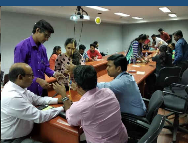
A training programme on customer service was organised for the Travel team in the Southern Region in two batches on 7 th and 12 th December 2018 at Chennai.